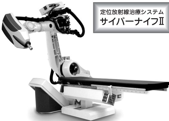
定位放射線治療システム サイバーナイフⅡ

すばらしい可能性を持つ放射線を 皆様に安心してご利用いただくことが私たちの願いです